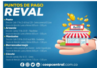
Conoce los puntos de recaudo Reval