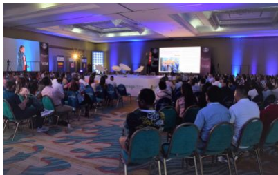
Así vivimos el 4º Congreso de la Red Coopcentral