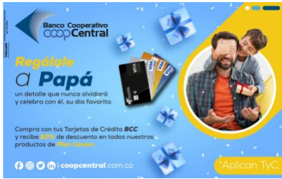
Compra el regalo de papá con las tarjetas crédito de nuestro Banco