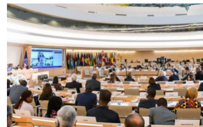
La 110 Conferencia Internacional del Trabajo aprobó las Conclusiones sobre el trabajo decente y la economía social y solidaria.