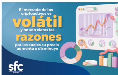
Criptoactivos, campaña de la Super Intendencia Financiera de Colombia.