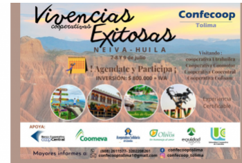
BCC apoya encuentro "Vivencias cooperativas exitosas" organizado por Confecoop Tolima