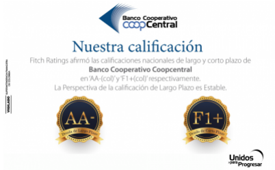
Fitch afirma nuestra calificación AA-(col) y 'F1+(col)