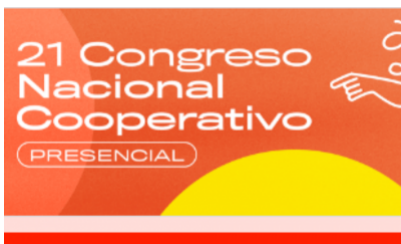
21º Congreso Nacional Cooperativo 2022, Formulario de Inscripción