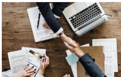
El 93% de las Cooperativas de ahorro y crédito en Colombia son mipymes