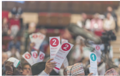
Disponible documentación oficial de la próxima Asamblea General de la Alianza Cooperativa Internacional