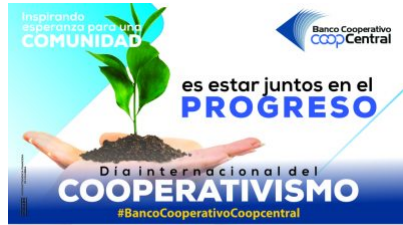
Celebramos el día del Cooperativismo