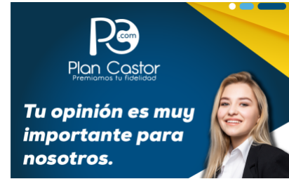
Responde esta breve encuesta