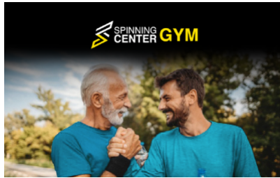
Paparchar en el Gym con papá