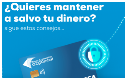
¡Cuidado con la suplantación de marca!