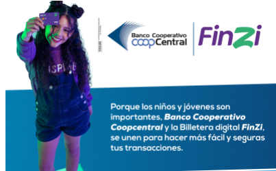
Nueva alianza para niños y jóvenes |Finzi