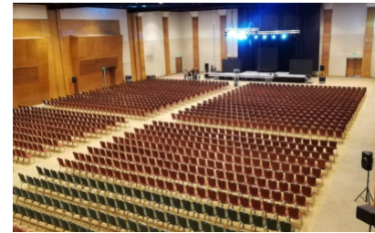
Comunicado de Prensa- Cooperativas de las Américas