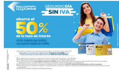
Día Sin IVA